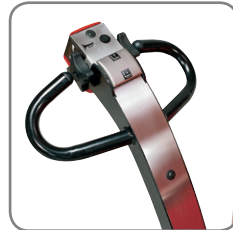
Manövrieren mit der Deichsel in aufrechter Stellung möglich. Alle Funktionen sind in der Deichsel integriert.