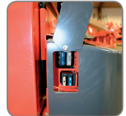
Leichter Zugang zu allen Bauteilen vereinfacht die Wartung des Wagens.