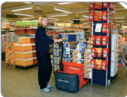
Panther Mini (Tragkraft 1400 kg) wird für leichten Paletten-transport, z.B. in Supermärkten und in Lägern, empfohlen.