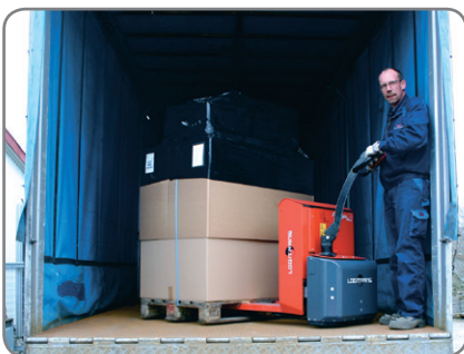
Panther Maxi (Tragkraft 1800 kg) wird für schweren Paletten-transport, z.B. für Speditionen, empfohlen.