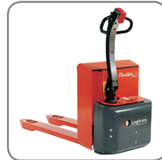
Robuste Konstruktion garantiert lange Lebensdauer und niedrige Wartungskosten.