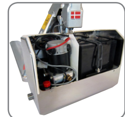
Wasserfeste Kapselung des Hubmotors (EHL RF-PLUS).

Bitte fordern Sie Werkstoff-Spezifikationen und kundenspezifische Lösungen an. Besuchen Sie auch www.logitrans.com .