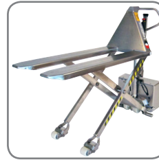
Geschlossene Gabel bedeutet einfache Reinigung und wenige Bakterienverstecke.