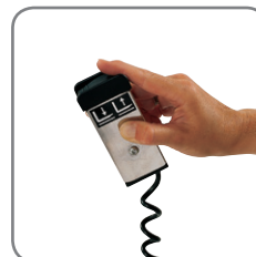
Fernbedienung, auch drahtlos, ist als Zubehör erhältlich (EHL).