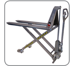
Der manuelle Scherenhubwagen ist auch in explosionsgeschützter Ausführung erhältlich.