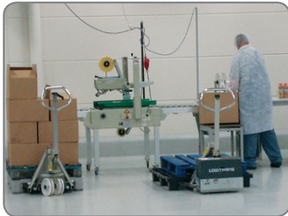
RF-PLUS - für die Lebensmittel- und Pharmaindustrie mit hohen Ansprüchen an Hygiene und Reinigung.

* Tragkraft reduziert sich von 1500 auf 1000 kg ab der Hubhöhe von 470 mm.