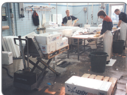
RF-SEMI - für die Lebensmittelindustrie in den Gebieten, wo Korrosionsbeständigkeit wichtig ist.