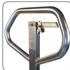
Ergonomische Deichsel sorgt für einen entspannten Griff.