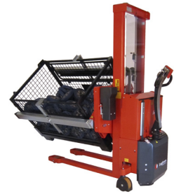
Der Rotator hat für Heben, Senken und Rotation Kabelfernbedienung als Standard. Funkfernbedienung ist für Heben, Senken und Rotation als Zubehör erhältlich.