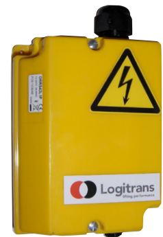
Der Empfänger für die Funkfernbedienung ist am Gerät montiert.