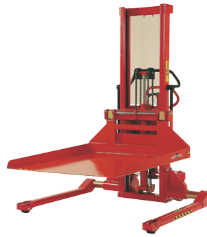
Als Zubehör werden u. a. Plattform und Kranarm angeboten.